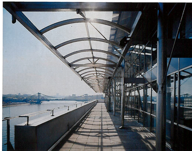
«Верхняя палуба» ММБ

Для нового банковского здания архитекторы приняли серьезные ограничения и по высоте, и по размерам. ММБ в отличие от памятника Петру I удачно вписался в исторический контекст Замоскворечья.