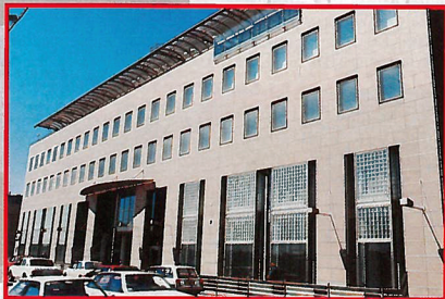
Асимметрия только украшает здание

Акционеры с самого начала активно участвовали в обсуждении проекта. И забраковали первый представленный макет, похожий, по их мнению, на тюрьму.