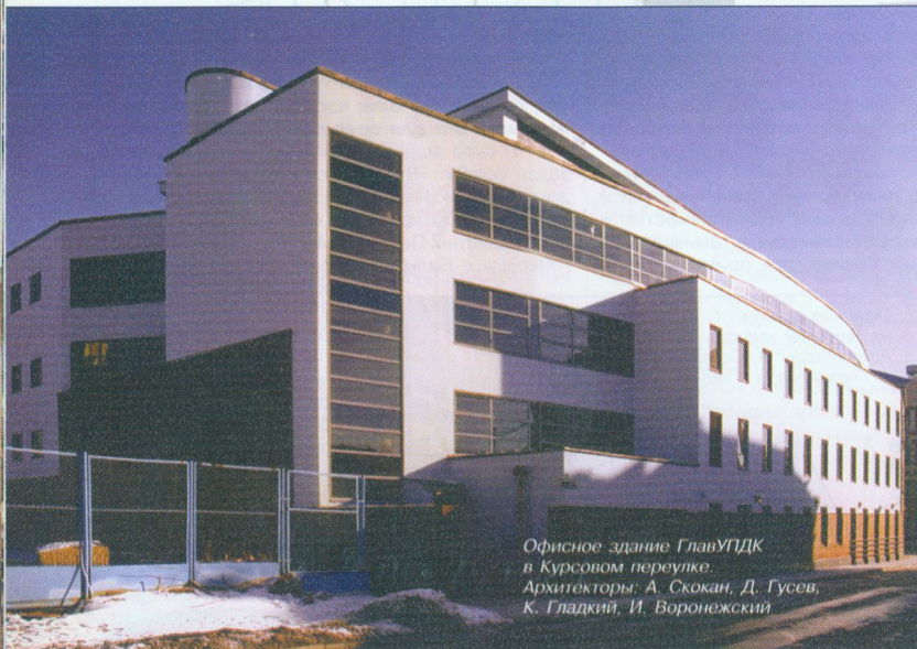
Офисное здание ГлавУПДК в Курсовом переулке. Архитекторы: А. Скокан, Д. Гусев, К. Гладкий, И. Воронежский

миру – Прага, Париж, Берлин, Бильбао – и каждое его здание немедленно становится местной достопримечательностью. Если по началу его шутки были более-менее неожиданными, то затем он попал в тираж, и от него теперь ждут еще более веселых шуток. Это туликовая ситуация. Так вот, на мой взгляд, существуют два пути развития современной архитектуры. Первый – создавать нечто, тяготеющее к логике, простоте, точности и целесообразности. Второй – создавать нечто, тяготеющее к сложным пластическим экспериментам, по определению излишнее и потому необязательное, имеющее большее отношение к скульптуре, чем к архитектуре. Конечно, мне ближе первый путь. Ведь во втором случае зачастую извращается сама постановка архитектурной задачи: в неистовых и самоценных попытках эстетического самовыражения архитектор порой совсем забывает о заказчике, о цели и мысли проекта.