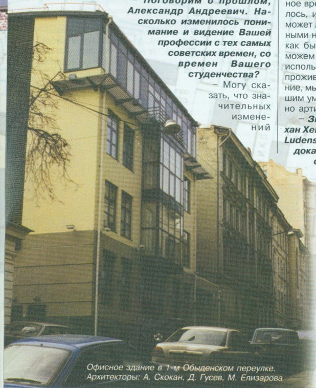
Офисное здание в 1-м Обыденском переулке. Архитекторы: А. Скокан, Д. Гусев, М. Елизарова