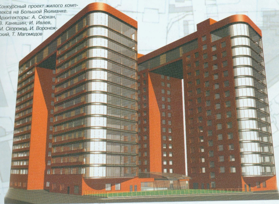
Конкурсный проект жилого комплекса на Большой Якиманке. Архитекторы: А. Скокан, В. Каняшин, И. Ивлев, М. Скорюход, И. Воронежский, Т. Магомедов