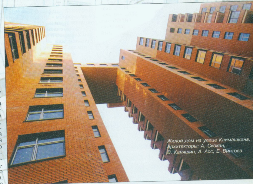
Жилой дом на улице Климашкина. Архитекторы: А. Скокан, В. Каняшин, А. Асс, Е. Винтова

– Тут позвольте мне такой вопрос. Вы определили стиль как логику. В вашем бюро работает 20 архитекторов. И вероятно, каждый из них ведет свой проект. Насколько совпадают