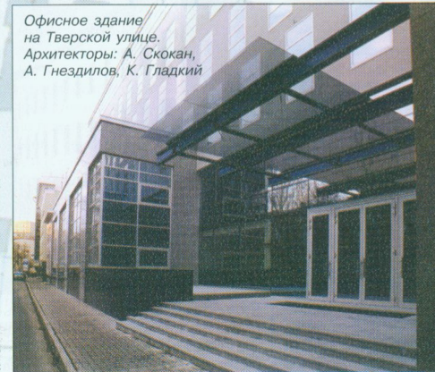
Офисное здание на Тверской улице. Архитекторы: А. Скокан, А. Гнездилов, К. Гладкий

– с явлением живой природы. Ситуация такого диалога более чем полезна современной архитектуре, так как появляется не надуманный, а реальный импульс для творческого акта, решения, высказывания. Остальное – дело логики и профессионального мастерства. В случае перекрытия двора музея эта логика безупречна – представьте себе «поведение» мыльного пузыря, вздутого над этим двором, в который погружается цилиндр. Образовавшаяся в результате этого криволинейная поверхность идеальна, так как единственно возможна. Дальше остается расчлнить эту поверхность треугольной сеткой, задать размеры и сечение каждого треугольника и собрать все это в натуре. Как результат, абсолютная гармоничность созданного пространства. Очевидно, современному архитектору стоит более внимательно относиться к окружающей природе, попросту учиться у нее, к примеру, у того же самого мыльного пузыря, а не заниматься собственными, не имеющими порой никакого отношения ни к заказчику, ни к месту застройки изысками.