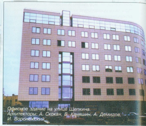
Офисное здание на улице Щепкина. Архитекторы: А. Скокан, В. Каняшин, А. Демидов, И. Воронежский

— Могу сказать, что значительных изменений