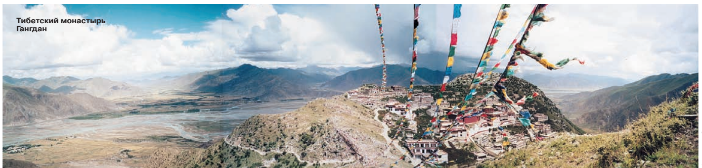
Тибетский монастырь Гандан